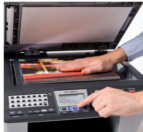
Escanee sus documentos A4 en color.

Resultados profesionales para su negocio: el equipo MFC-8890DW le ayuda a reducir costes con el tóner de larga duración, el dúplex automático en impresora, fax, copiadora y escáner y otras funciones que multiplicarán su productividad.