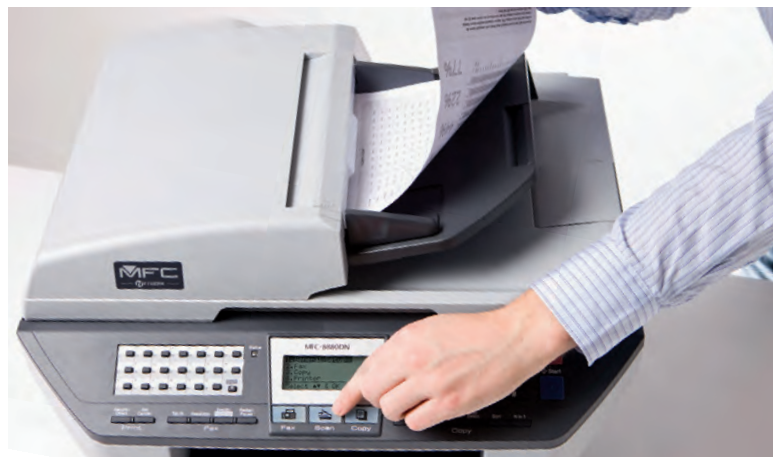
Alimentador automático de documentos. Perfecto para enviar faxes, copiar o escanear documentos de múltiples páginas.