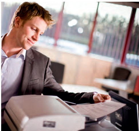
Resultados impactantes al instante con una velocidad de impresión de hasta 32ppm.